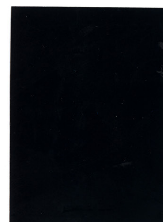
Negro / Black 120 cm x 50 m

*Otros colores bajo pedido · Other colors under request