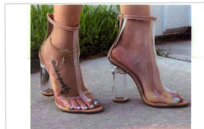
Cristal / Clear 120 cm x 50 m