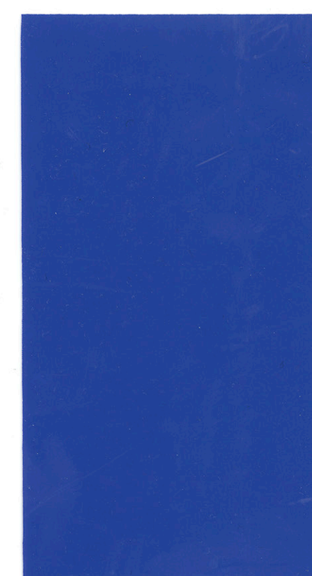
Azul oscuro / Dark blue 220 cm x 80 m

*Otros colores bajo pedido · Other colors under request