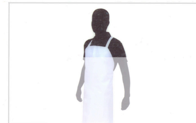
Translúcido / Translucent 120 cm x 50 m