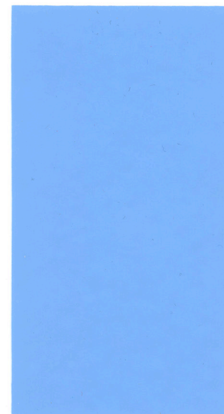
Azul claro / Light blue 220 cm x 80 m