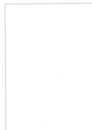
Blanco / White 120 cm x 50 m