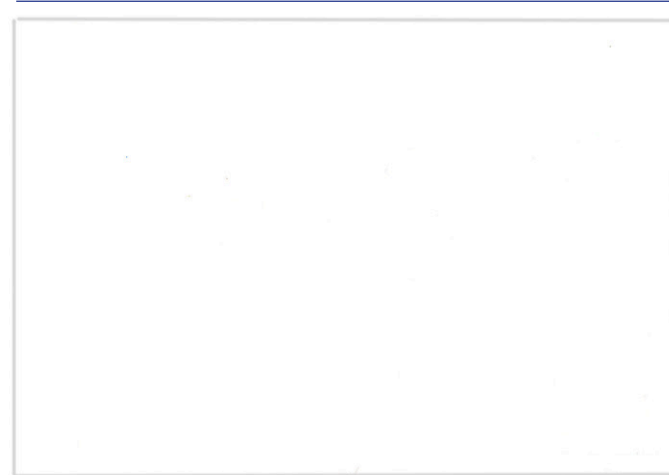
Blanco / White 140 cm x 100 m