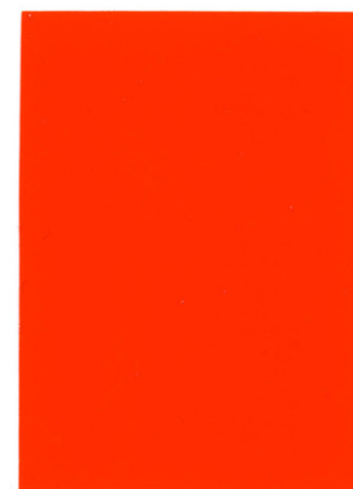
Naranja / Orange 120 cm x 50 m