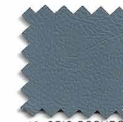
10. GRIS OSCURO