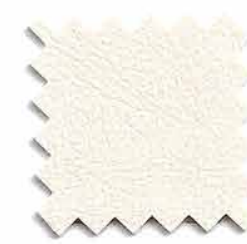
14. BEIGE CLARO