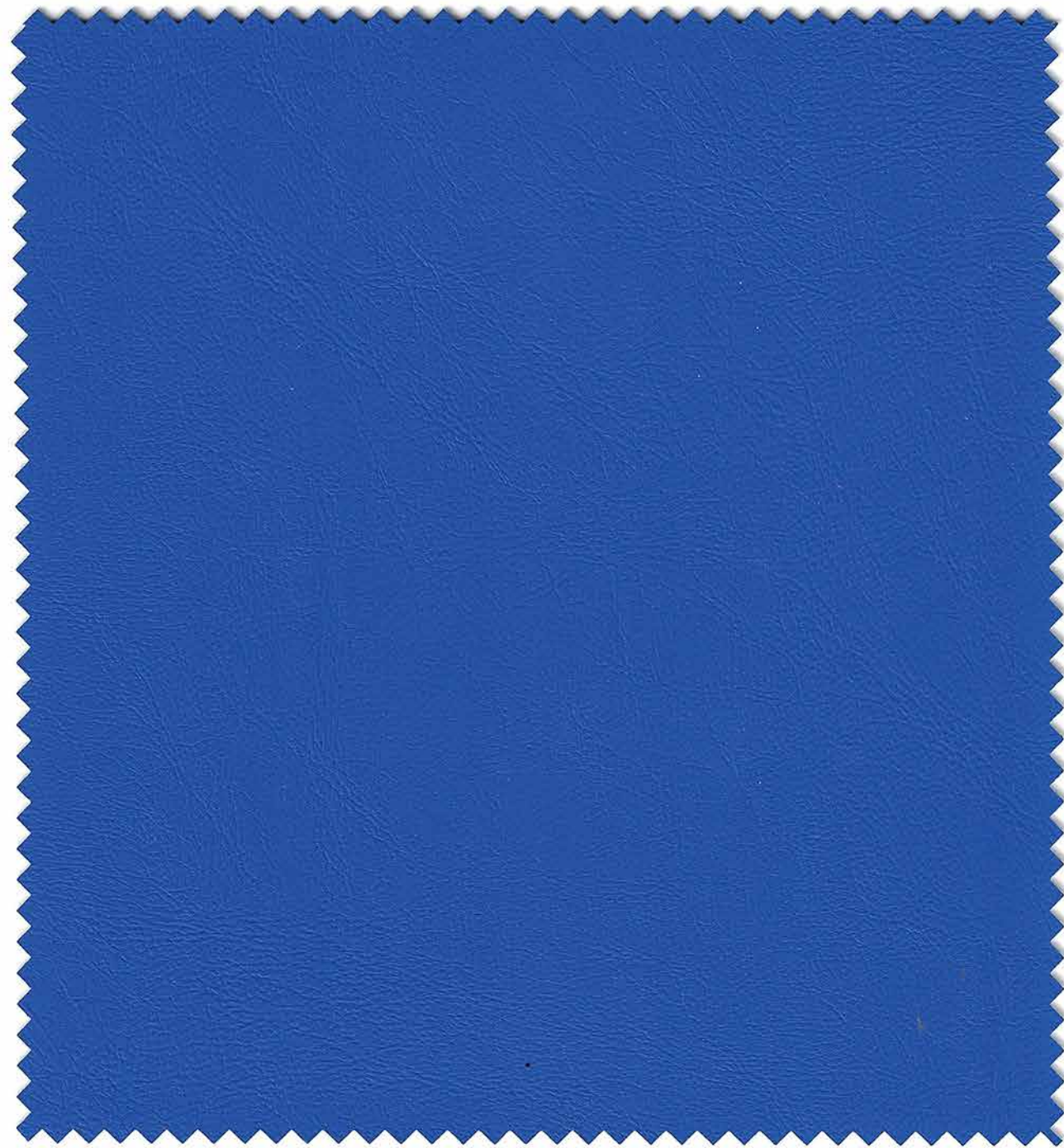
08. AZUL MEDIO