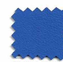
08. AZUL MEDIO