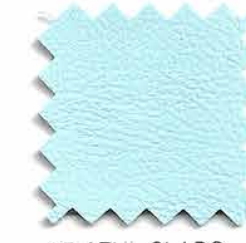
17. AZUL CLARO